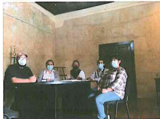
Reunión con Administradores

Museo de Arte Colonial, 5ta calle oriente N°5, La Antigua Guatemala