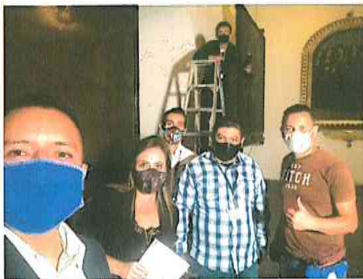
Edición de material de divulgación